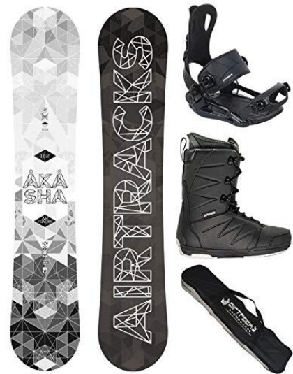
Abbildung 1 Symbolbild, Snowboard Ausrüstung

Da ich noch nie Snowboard fuhr, besass ich auch keine Ausrüstung. Als erstes besorgte ich mir eine Ausrüstung. Da ich nicht wusste, ob ich weiterhin snowboarden würde, erschien mir das Mieten am sinnvollsten. Ich mietete eine Ausrüstung bestehend aus Schuhen und Board für die Dauer einer Saison zum Preis von 300.- Franken. Das Board liess ich für einen «Goofy» Fahrstil einstellen, das heisst für den Fahrstil mit dem rechten Fuss vorne. Für eine «Goofy» Einstellung werden die Bindungen leicht nach rechts gedreht, um eine bessere Kontrolle übers Board zu haben. Auch war es ein Board welches nicht zu Hart aber auch nicht zu weich war, ein gutes Board für einen Anfänger.