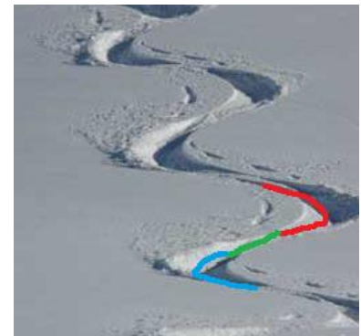
Abbildung 3 Ideale Snowboard Spur Goofy: Orange = Aussenkante Grün = Wechsel Blau = Innenkante