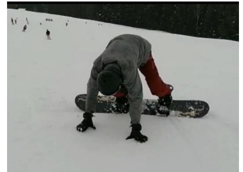
Abbildung 2 Ich am Aufstehen kurz nach dem ersten Sturz.

Den zweiten Versuch startete ich in Malbun, einem mittelgrossen Skigebiet im Fürstentum Lichtenstein. Dort übte ich weiter. Die Piste war sehr eisig, was sich als sehr unangenehm herausstellte. Oft stürzte ich, weil die hintere Kante einfach über das Eis rutschte und mir keinen Halt gab. Am Ende dieses Tages war ich um viele Erfahrungen reicher. Die erste Schwarze Piste war, wenn auch nicht allzu schnell,